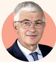
Vincent BOGUCKI Président de la CFE-CGC BTP

Dans le Bâtiment, syndicats et patronat sont parvenus à un accord revalorisant de 1,2 % la grille des salaires minima. Dans les TP, une décision unilatérale de réévaluation de 1 % a été prise.