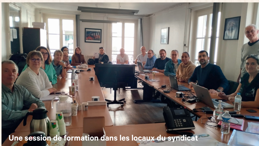
Une session de formation dans les locaux du syndicat

Soulignons aussi la qualité des formations et des interventions, ainsi que des échanges avec les formateurs, particulièrement appréciés durant ces journées. Les formations en présentiel et/ou visio-conférence, se déroulent habituellement sur une